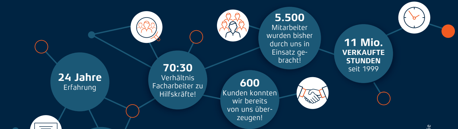
UMSATZWACHSTUM 1999 - 2022